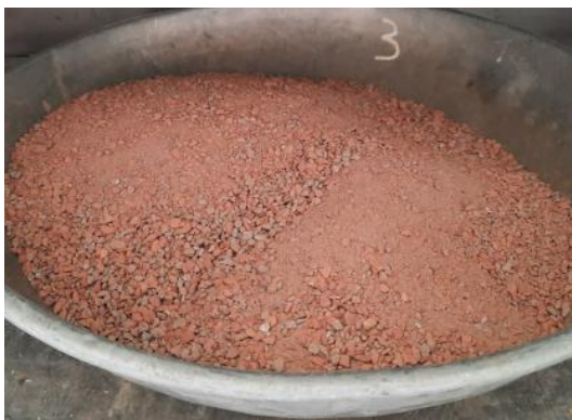
Hình 3. Sản phẩm nghiền từ tường gạch.

Mẫu hình trụ có kích thước D=150\text{ mm} ; H=300\text{ mm} : 3 tổ gồm tổ 1 (cát sông Tiền 3 mẫu), tổ 2 (sản phẩm nghiền từ bê tông sàn 3