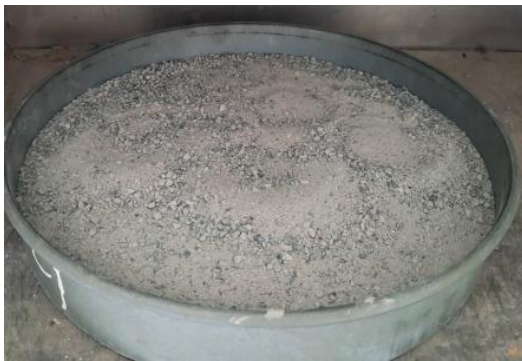
Hình 2. Sản phẩm nghiền từ bê tông sàn.