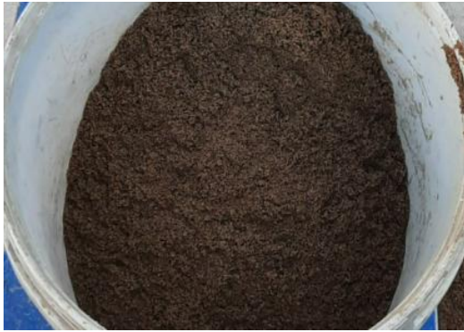
Hình 1. Cát vàng sông Tiền.