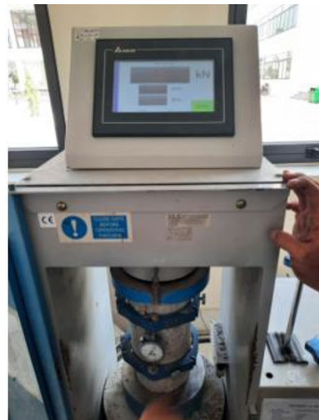
Hình 4. Nén mẫu thí nghiệm.

Xác định mô đun đàn hồi của bê tông theo quy định, hoàn thành vào các bảng kết quả thí nghiệm.