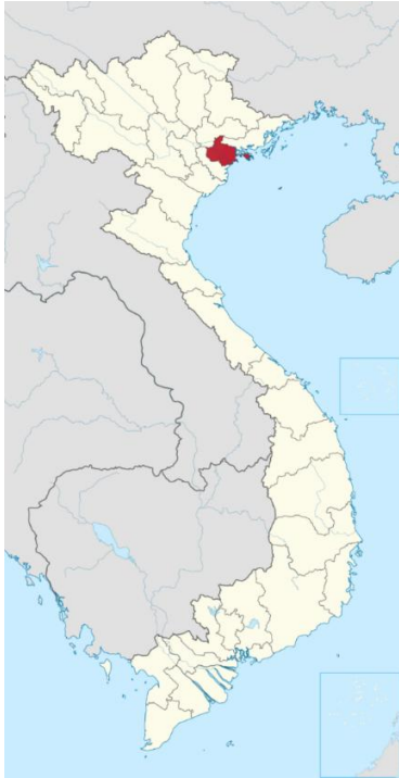
Hình 1. Vị trí Thành phố Hải Phòng trên bản đồ Việt Nam.

một trong những khu vực chịu ảnh hưởng nặng nề của biến đổi khí hậu (xem hình 1).