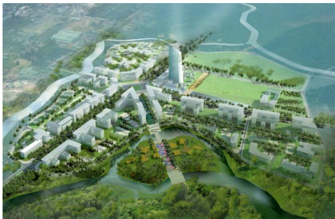
Hình 13. Dự án đô thị đại học Đà Nẵng [13].

Dự án đô thị Đại học Đà Nẵng được phê duyệt từ tháng 12/1997 với quy mô phục vụ khoảng 60000 sinh viên tính đến năm 2035; diện tích gần 287 ha thuộc phường Hòa Quý (quận Ngũ Hành Sơn, TP Đà Nẵng) và phường Điện Ngọc (thị xã Điện Bàn, Quảng Nam). Đây là khu chức năng đặc thù, là trung tâm giáo dục đào tạo và nghiên cứu khoa học đa ngành, đa lĩnh vực cấp quốc gia và quốc tế; Gồm các khu cơ bản sau: khu trung tâm, khu học tập và khu nghiên cứu.