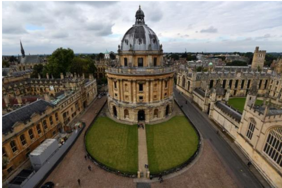
Hình 5. Đại học Oxford [5].

Đại học Oxford có hơn 40 trường thành viên hợp lại, không có tường bao ngăn cách với thành phố, không có cổng trường, các trường này đều tự điều hành, nhưng có một bộ phận quản lí chung đứng đầu. Các khoa, viện chuyên ngành được phân bố khắp đô thị. Các tiện nghi giáo dục đáp ứng đầy đủ cho mọi cấp học. Phần lớn các trường thành viên của đại học Oxford có lịch sử lâu đời hơn 800 năm với phong cách kiến trúc thời Trung cổ tạo cảm giác uy nghi, bề thế.