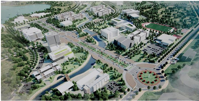
Hình 12. Dự án đô thị đại học quốc gia Hà Nội [12].