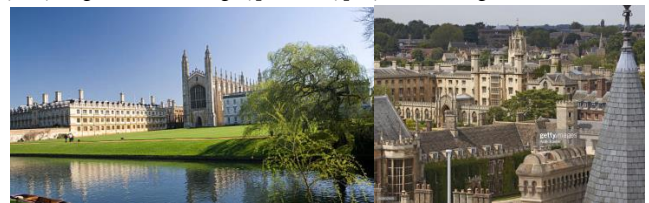
Hình 8. Đại học Cambridge [8].

Đại học Cambridge được thành lập năm 1209, với tên đầy đủ là “Viện đại học nghiên cứu công lập liên hợp tại Cambridge”, Anh.