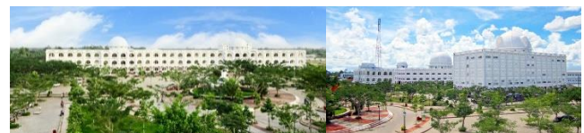
Hình 15. Khu giảng đường lý thuyết và Khu trung tâm thực hành, thí nghiệm y dược - với sắc trắng đặc trưng [14].

Cùng với định hướng phát triển trở thành một thành phố Đại học với hệ thống quản lý giáo dục tiên tiến, trường Đại học Võ Trường Toản đầu tư tập trung về cơ sở hạ tầng kỹ thuật nhằm đáp ứng tốt nhất nhu cầu học tập và sinh hoạt của sinh viên. Tại đây, mọi hoạt động dạy và học diễn ra theo một hệ thống thống nhất và đặc biệt là hình thành nên một môi trường học tập và sinh hoạt quy mô, chuyên nghiệp mang nét văn hóa đặc trưng của nhà trường. Trong môi trường học tập năng động và tiện lợi, mỗi sinh viên là một tế bào xây dựng nên một xã hội thu nhỏ lành mạnh, trong sạch, thân thiện và tính kỷ luật cao.