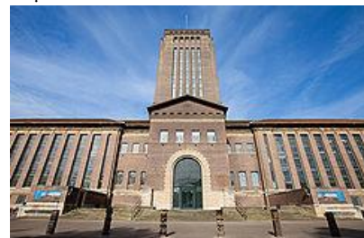
Hình 9. Thư viện đại học Cambridge [9].

Để phục vụ hơn 18000 sinh viên, trường sở hữu tới 9 bảo tàng nghệ thuật, khoa học và văn hoá. Bên cạnh đó, trường có tới 114 thư viện. Thư viện đại học Cambridge là thư viện nghiên cứu trung tâm, lưu trữ hơn 8 triệu đầu sách.