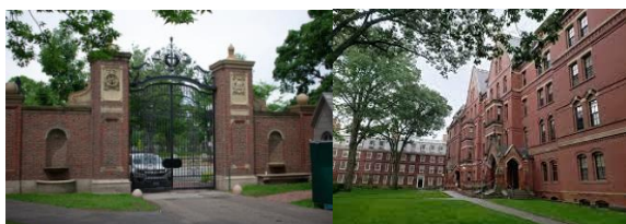
Hình 1. Cổng Johnston và khu giảng đường của đại học Harvard [1].

Harvard ban đầu là một khu vực trường nhỏ, với những ngôi nhà độc lập. Mỗi ngôi nhà đều có một khuôn viên riêng với những giảng đường, ký túc xá và khu văn phòng. Do được phát triển dần theo thời gian nên mỗi khu vực của trường đều hoàn thiện dần các công năng như giảng đường, phòng thí nghiệm, ký túc xá. Hiện nay, tại đây tập trung xây dựng rất nhiều những trung tâm nghiên cứu, thí nghiệm chuyên ngành và các công ty, đơn vị kỹ thuật.