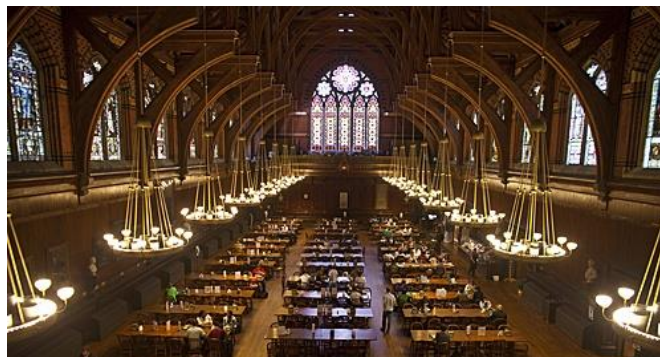
Hình 3. Một khu vực nhà ăn của đại học Harvard [3].

Căn tin của trường cũng thường được nhắc đến với những xuất ăn phong phú. Điểm nhấn của nhà ăn là tông màu nâu gỗ ấm cúng, kết cấu mái vòm và trang trí bằng những chiếc đèn chùm cỡ lớn.