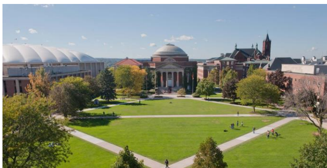
Hình 4. Đại học Boston [4].

Đại học Boston được thành lập năm 1839, với tiền thân là Viện Newbury Biblical tại Newbury, Vermont. Nằm ở trung tâm của Boston lịch sử, với quy mô khuôn viên là 134 mẫu Anh, đại học Boston là một trường đại học giảng dạy và nghiên cứu với hơn 15 trường đại học, cao đẳng, hơn 300 chuyên ngành và hơn 650 khóa học toàn cầu.