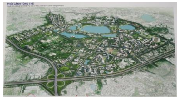
Hình 14. Dự án đô thị đại học quốc gia Hồ Chí Minh [14].

Khu đô thị sau khi hoàn thành sẽ gồm 05 khu chức năng lớn: Khu hành chính - dịch vụ; Khu đào tạo; Khu nghiên cứu - chuyển giao công nghệ (bao gồm khu phần mềm và công viên khoa học); Khu ký túc xá; Khu thể dục thể thao.