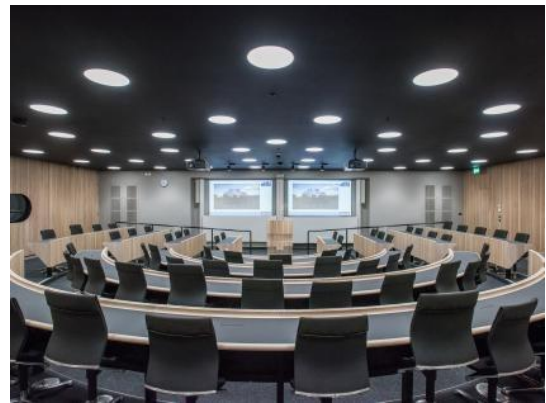
Hình 7. Giảng đường của đại học Blavatnik [7].

Giảng đường của đại học Blavatnik (thuộc Đại học Oxford) được thiết kế cong để tạo điều kiện tương tác tốt hơn giữa các sinh viên cũng như với giảng viên, được trang bị các phương tiện nghe nhìn hiện đại. Không gian giảng dạy linh hoạt, có thể được sử dụng như một phòng lớn duy nhất cho các bài giảng và hội nghị với sức chứa lên đến 200 người hoặc được chia thành bốn không gian riêng biệt cho các cuộc hội thảo, thảo luận nhóm và họp nhỏ hơn.