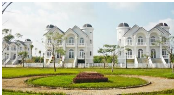
Hình 16. Các tòa của nhà khu biệt thự được thiết kế theo lối kiến trúc cổ Châu Âu [14].